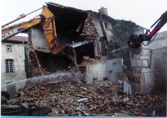
Démolition maison 1 Rue Michel de l'Hospital Octobre 2018