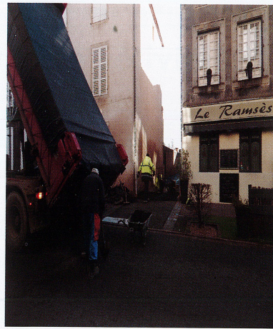
Rénovation de l'Impasse Voyret Novembre 2018