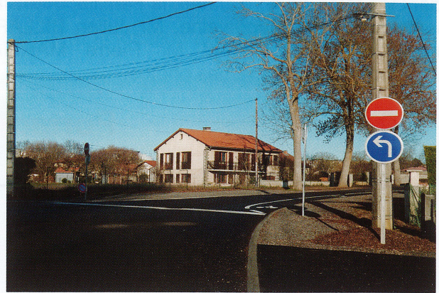
Travaux Allée de la Chapelle Septembre/Octobre 2018