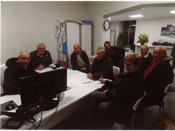
Réception de gilets jaunes en Mairie cahier des doléances – 13/12/2018