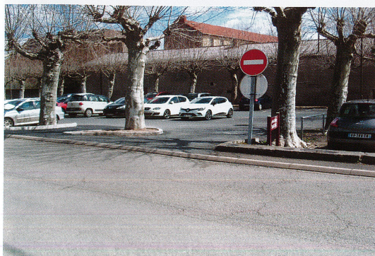
Nouvelle entrée Parking Place d'Orléans Printemps 2018