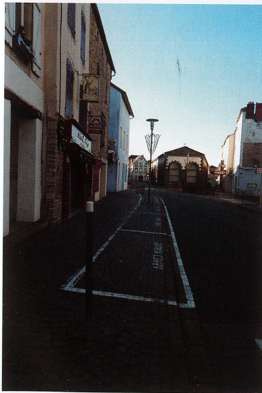
Arrêt minute en centre ville Septembre/Octobre 2018