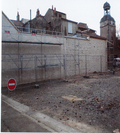
Création de places de parking Rue Michel de l'Hospital Décembre 2018