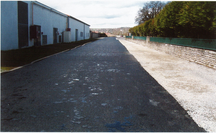
Travaux Allée des Pêcheries Mai/Juin 2018