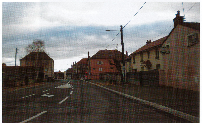
Carrefour feux rouges et réfection des trottoirs – Boulevard de la Nation Mars/Avril 2018